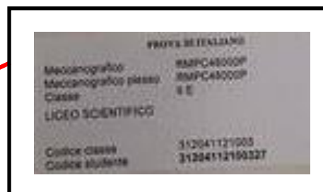
Immagine 2: ETICHETTA

3. Si assicuri , inoltre, che il locale stabilito per la somministrazione sia stato preparato con un numero sufficiente di banchi nel limite del possibile adeguatamente separati in modo che gli alunni non possano comunicare con i compagni vicini o copiare gli uni dagli altri. Per la V primaria si assicuri che siano stati predisposti gli strumenti necessari per lo svolgimento della prova d'Inglese-ascolto (listening).